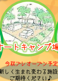
オートキャンプ場