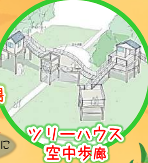
ツリーハウス 空中歩廊