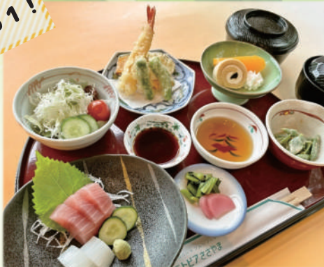
ミニ会席 1,600円 Traditional Japanese Course Meal