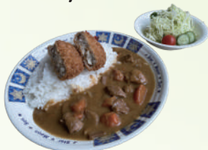
ビーフカレー 1,000円 (黒豆コロッケ付き) Croquette Beef Curry