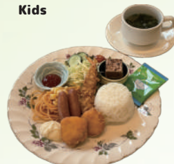
ちょこっとランチ 700円 Small Size Set Meal / Kids Meal