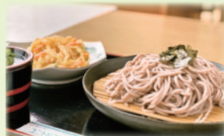
かき揚げ天ざるそば・うどん 1,100円 Cold Udon (or Soba) with Tempura