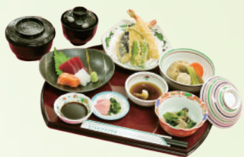
ミニ会席 1,600円 Traditional Japanese Course Meal