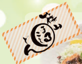
猪肉のミルフィーユ味噌カツ丼 1,400円 Deep-Fried Wild Boar Cutlet Rice Bowl