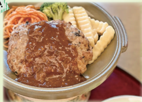
丹波ささやま黒豆ハンバーグ定食 1,200円 Salisbury Steak Set Meal