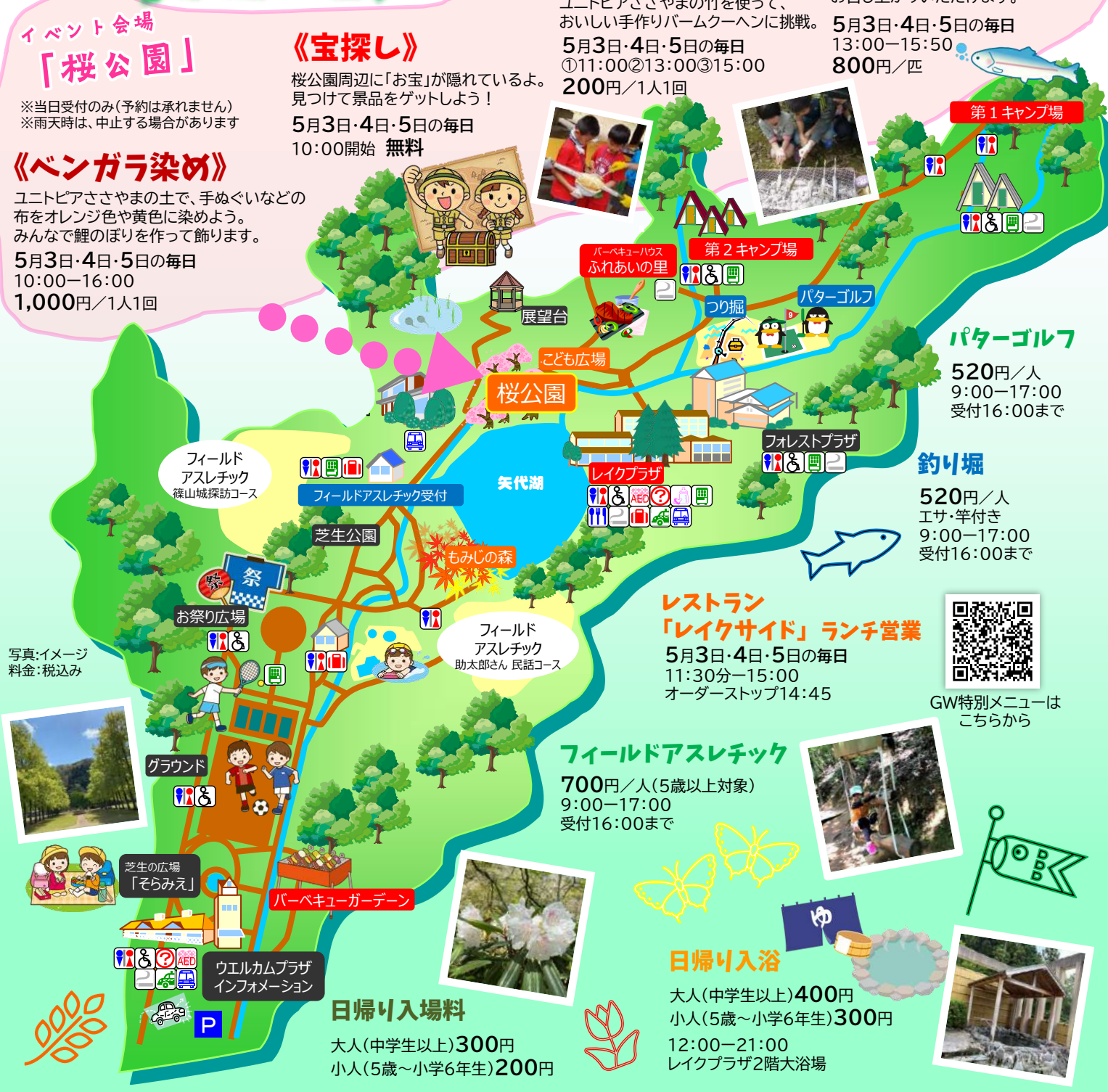
写真:イメージ 料金:税込み