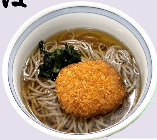
小麦 乳 卵、そば