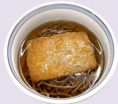
小麦 卵 そば