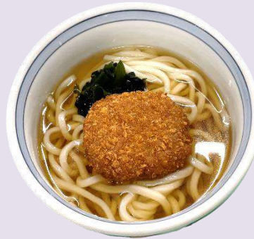
小麦 乳 卵