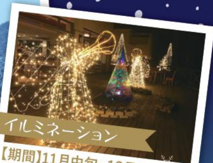
イルミネーション

深い霧が立ちこめる里山の冬。雪が降れば一面の銀世界となります。都会の喧騒をはなれ、静かな里山の冬をお過ごしください。