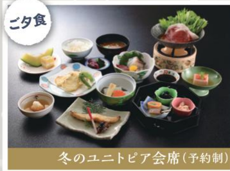
冬のユニットピア会席(予約制)