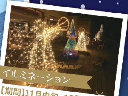
イルミネーション

深い霧が立ちこめる里山の冬。雪が降れば一面の銀世界となります。都会の喧騒をはなれ、静かな里山の冬をお過ごしください。