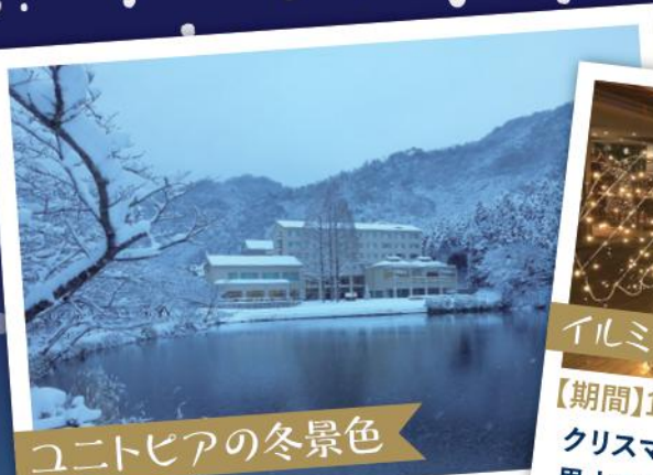
ユートピアの冬景色

深い霧が立ちこめる里山の冬。雪が降れば一面の銀世界となります。都会の喧騒をはなれ、静かな里山の冬をお過ごしください。