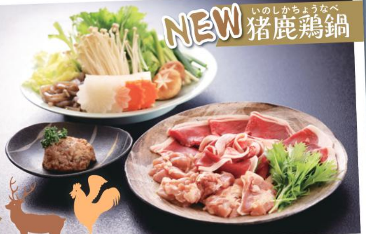
NEW いのしかちょうなべ 猪鹿鶏鍋

今年初登場のオリジナル鍋。地元産の「天然しし肉」、「天然しか味付けミンチ」、「国産鶏もも肉」を料理長オリジナルの特製白みそ出汁で煮込む、滋味あふれるお鍋です。