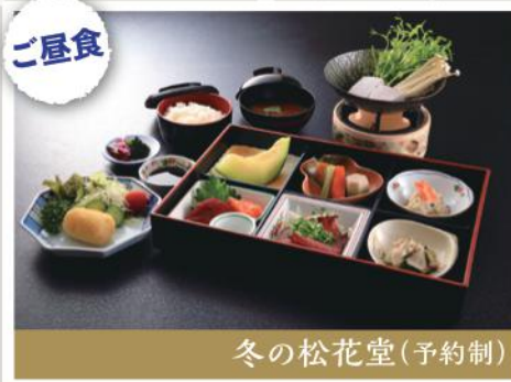
冬の松花堂(予約制)

冬の丹波篠山の名物「ぼたん肉」をはりはり鍋で、 季節の素材も豊富な会席料理です。 その他メニューもご用意しております。