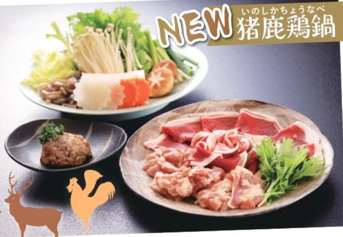
NEW いのしかちょうなべ 猪鹿鶏鍋

今年初登場のオリジナル鍋。地元産の「天然しし肉」、「天然しか味付けミンチ」、「国産鶏もも肉」を料理長オリジナルの特製白みそ出汁で煮込む、滋味あふれるお鍋です。