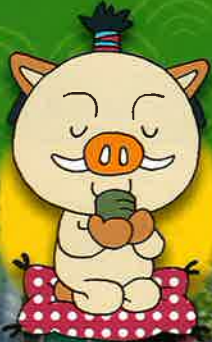
丹波篠山市 マスコット キャラクター まるいの